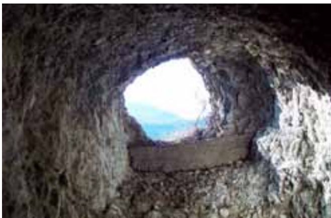
Illustrazione della storia dei “recuperanti” di bombe di Nago.

Sentiero di montagna sassoso nella parte più alta ma per tutti, con scarpe da trekking o scarponcini per escursioni in montagna. Da vedere: strada militare 1915, ruderi di casematte, trincee, camminamenti, panorama unico con “avvistamenti” di elementi di flora e fauna con binocolo e senza.