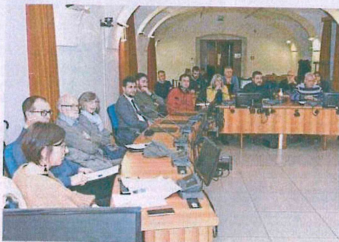
• L'incontro in Rocca, l'altra sera, per la presentazione delle proposte del bilancio partecipato.