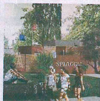
• Il rendering dei nuovi bagni in spiaggia