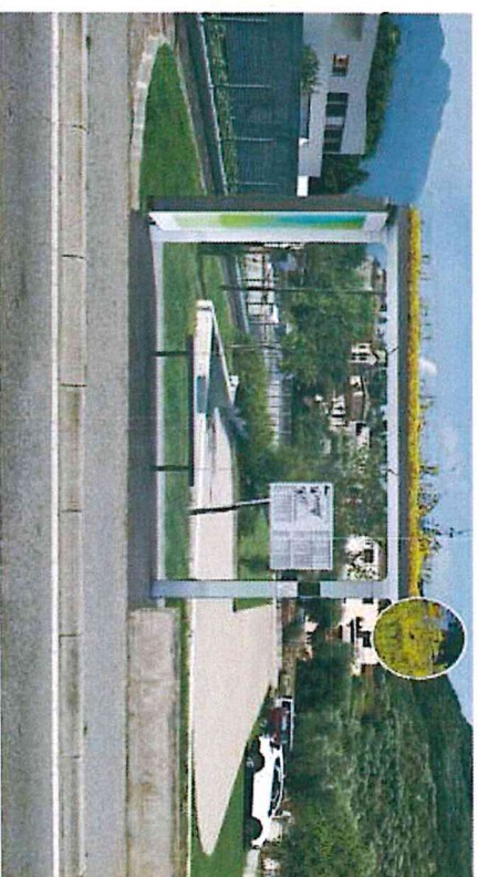
Rendering della pensilina.