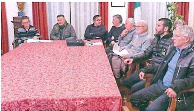
«In municipio a Riva sono state annunciate le opere che verranno realizzate con i soldi del "Bilancio partecipato"»

I progetti che hanno ottenuto maggior successo, dovranno però ora subire l'iter amministrativo, a partire dalla va-