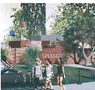
«Il rendering dei nuovi bagni alla spiaggia Sabbioni»

biettivo è quello di fare meglio: si può pertanto pensare, nonostante le difficoltà organizzative che questo comporta, di trovare una soluzione per permettere agli anziani di votare senza necessariamente l'utilizzo di internet, ma anche di coinvolgere i più giovani. Per quest'edizione avevamo abbassato l'età di voto ai 16 anni, ma ci sono comunque stati solamente due votanti sotto i 20 anni. L'interesse, insomma, sembra cominciare a manifestarsi solo sopra i 35'. Dobbiamo allora pensare - la conclusione del vicesindaco - ad una comunicazione per mezzo sociale o a una collaborazione con le scuole o con la biblioteca, in modo da far sì che anche questa fascia di popolazione si esprima».