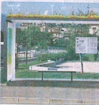
• Il progetto della pensilina di Sant'Alessandro