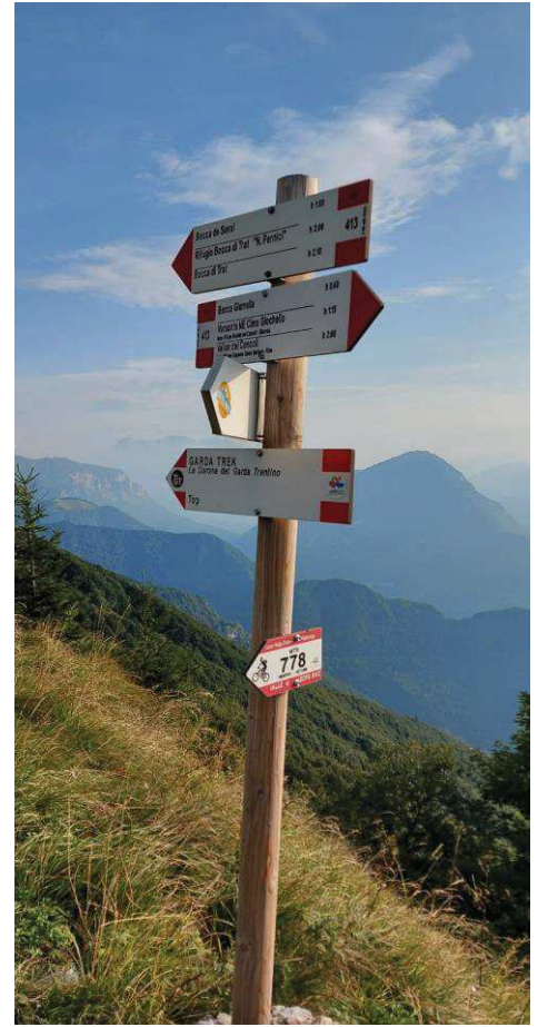
Foto della segnaletica posizionata a ridosso della baita "Comai" posta sul sentiero 413 scattata in data 22.08.21:

A PAGINA SUCCESSIVA SEGUONO GLI ALLEGTI: