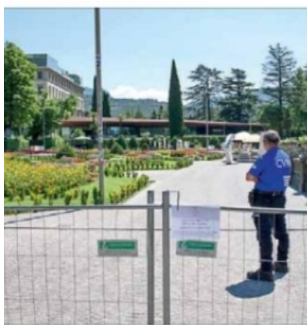
l'agente della vigilanza all'accesso dei Giardini del Lido