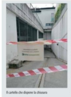
Il cartello che dispone la chiusura