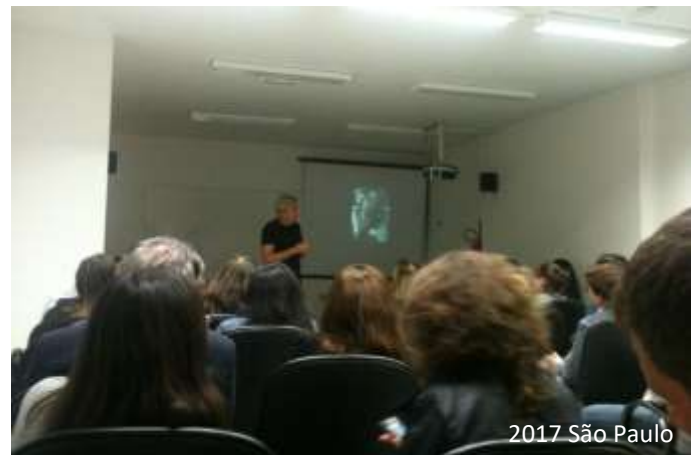
2017 São Paulo