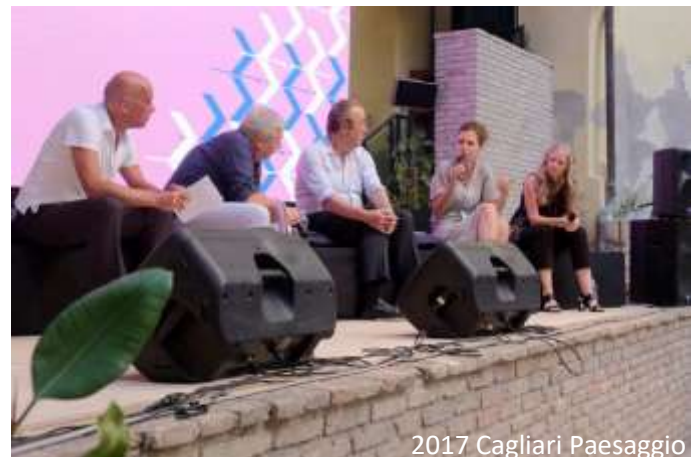
2017 Cagliari Paesaggio