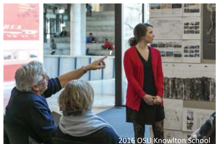
2016 OSU Knowlton School