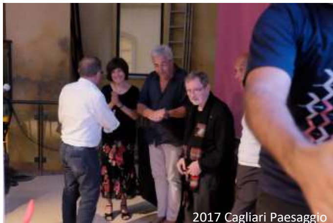
2017 Cagliari Paesaggio