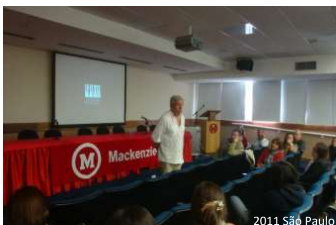
2011 São Paulo