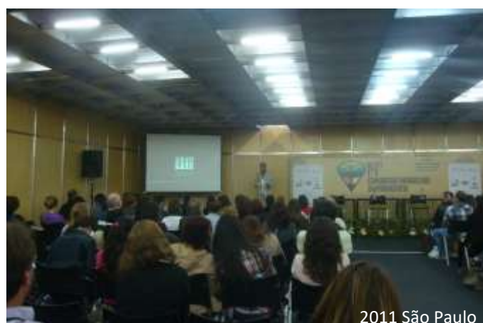
2011 São Paulo