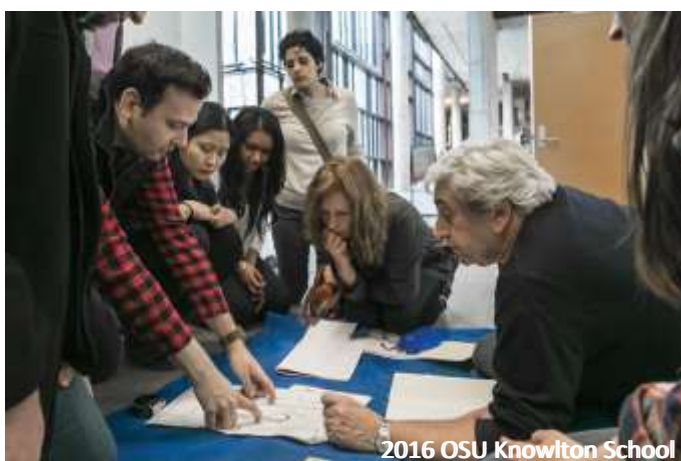
2016 OSU Knowlton School