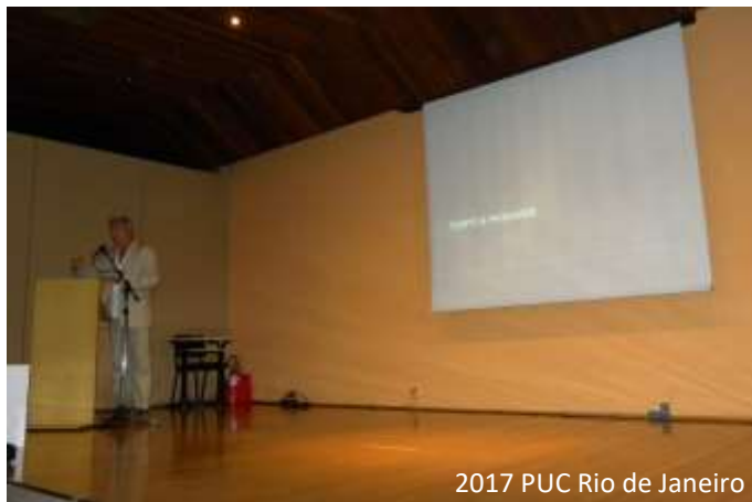
2017 PUC Rio de Janeiro