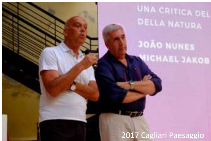
2017 Cagliari Paesaggio