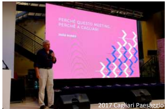
2017 Cagliari Paesaggio