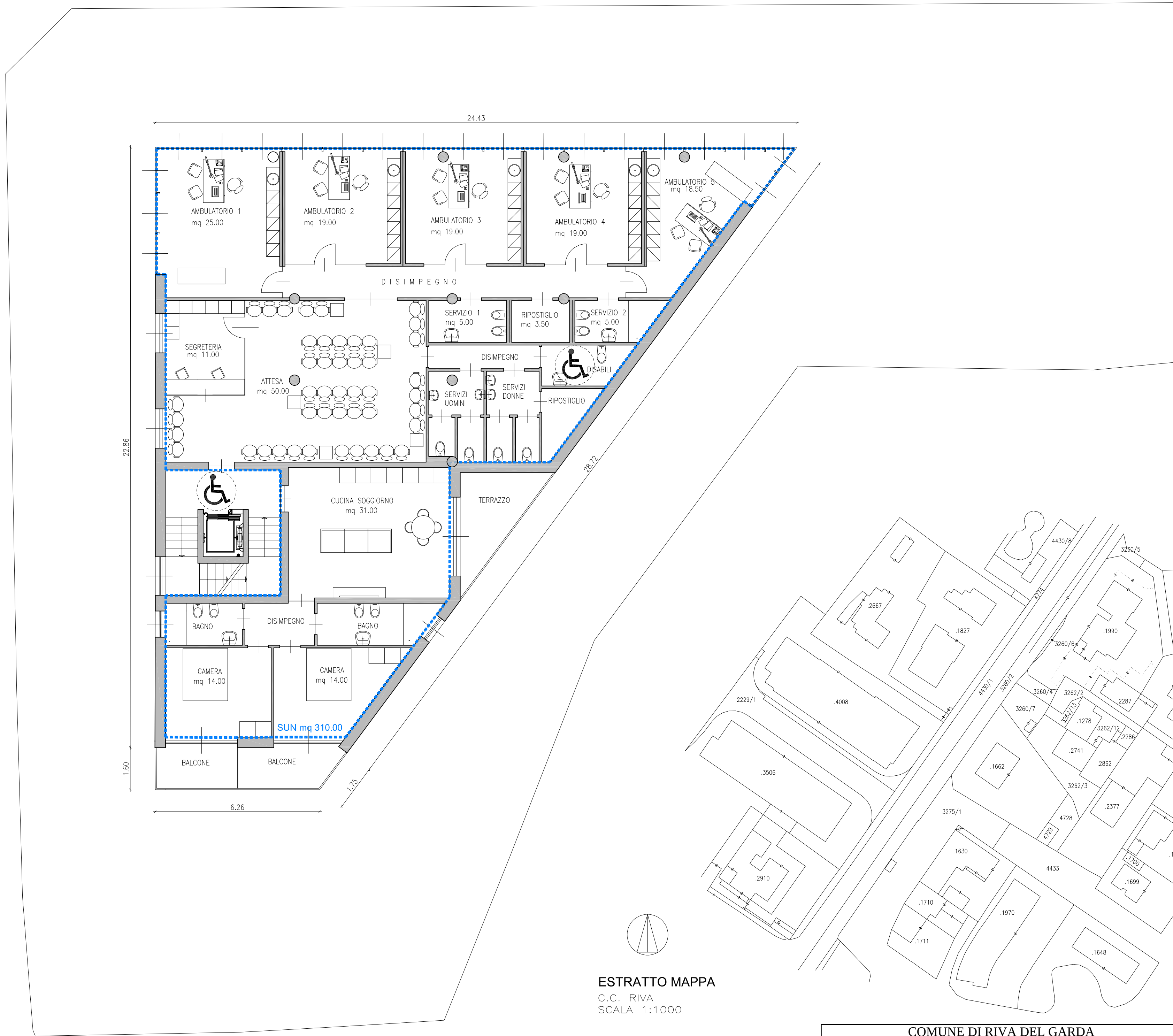
PIANTA PRIMO PIANO SCALA 1:100