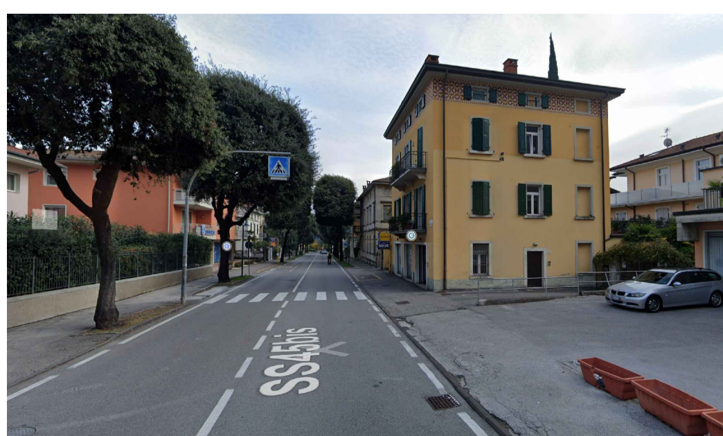
(2) VIALE MADRUZZO