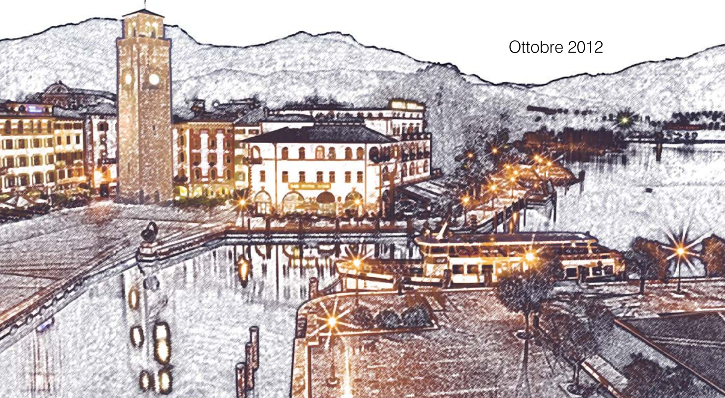
Tavola numero: TAV 01 Quadrante n°: 01-02-03 Formato: A0* Scala: -:-

Titolo Tavola: INDIVIDUAZIONE DI AREE ILLUMINOTECNICAMENTE OMOGENEE